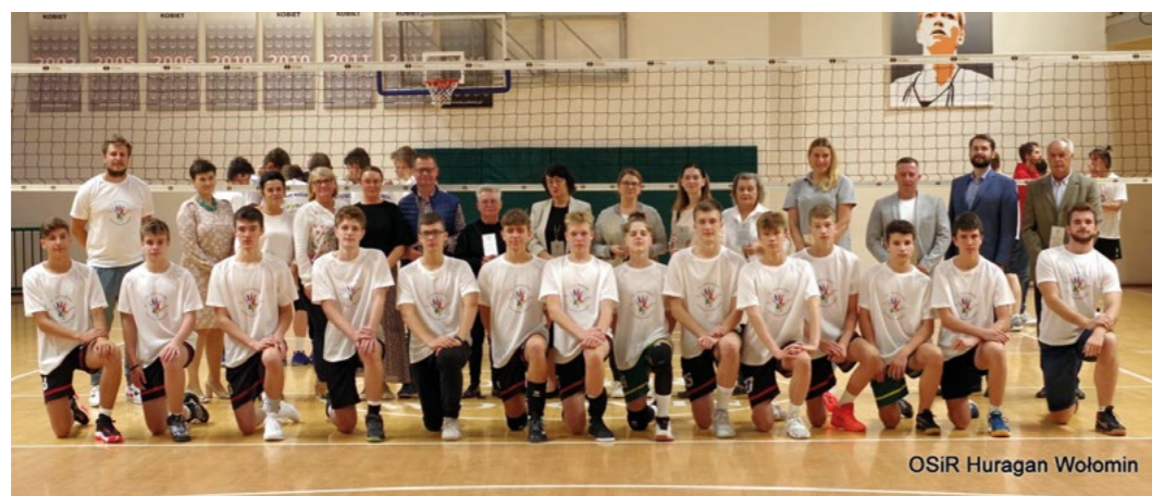
OSIR Huragan Wołomin

Kiedy dziesięć lat temu grupa osób powoływała klub siatkarski UKS Piątka działający przy Sportowej Szkole Podstawowej nr 5, warunki były mało sprzyjające. Pomimo to, kilka osób podjęło się tego wyzwania.