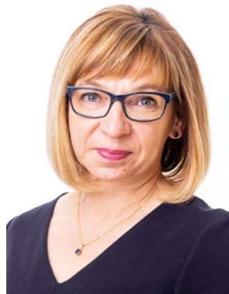
ELŻBIETA RADWAN BURMISTRZ WOŁOMINA

Przed nami święta Zmartwychwstania Pańskiego, najuroczyściej obchodzone święto