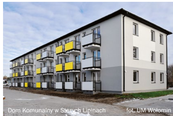
Dom Komunalny w Starych Lipinach

innymi na osiedlu Niepodległości i osiedlu Słoneczna, na Huraganie, w Czarnej, w Zagościńcu i w Majdanie. Zakończyliśmy rozbudowę szkoły w Zagościńcu, budowę bieżni na terenie Sportowej Szkoły Podstawowej nr 5 im. Polskich Olimpijczyków w Wołominie, remont hali gimnastycznej w I LO im. Wacława Nałkowskiego w Wołominie i budowę wielofunkcyjnego boiska sportowego w Starych Grabiach. Skończyliśmy też budowę nowego Domu Komunalnego dla najbardziej potrzebujących przy ul. Rolnej w Nowych Lipinach. Zmierzamy do zakończenia budowy Biblioteki Sąsiedzkiej w Lipinkach i budowy windy w Miejskim Domu Kultury w Wołominie. Możemy się już cieszyć zmodernizowanym budynkiem Starej Elektrowni, który stał się najbardziej klimatycznym miejscem w Wołominie.