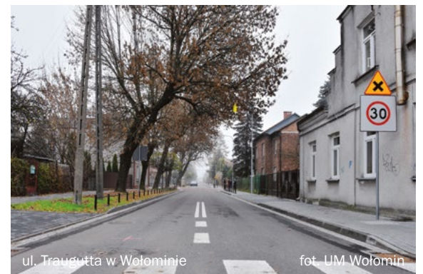
ul. Traugutta w Wołominie

o geotermii - wykorzystaliśmy szansę na poszukiwanie wód termalnych. Wierzę, że dzięki tym drżącym w naszej ziemi pokładom czystej energii Wołomin w ciągu maksymalnie 15 lat będzie miastem bez niskiej emisji i przykładem dobrego wykorzystania naturalnych zasobów. Dbamy też o estetykę - murale, neony, rzeźby miejskie, parki, skwery i tętnie. To wszystko sprawia, że Wołomin nie tylko się rozwija, ale pięknieje i tętni życiem.