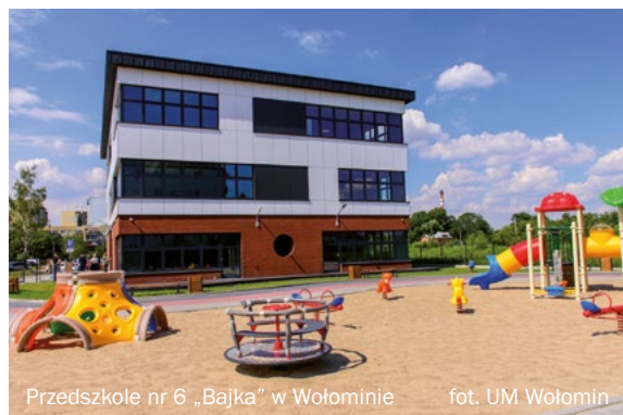
Przedszkole nr 6 „Bajka” w Wołominie fot. UM Wołomin

W listopadzie minęło 5 lat mojej drugiej kadencji. W myśl słów ślubowania, sprawowałam urząd burmistrza zgodnie z prawem, dla dobra publicznego i pomyślności mieszkańców. Jestem dumna z tego, co wspólnie udało się nam osiągnąć - zrealizowaliśmy wiele projektów i wdrożyliśmy szereg potrzebnych rozwiązań. Zrobiliśmy to wspólnie, bo na ten sukces pracował sztab ludzi, którym z całego serca dziękuję za to, że chce im się chcieć. Wołomin może się rozwijać dzięki zaangażowanym mieszkańcom, urzędnikom, radnym, przedstawicielom organizacji pozarządowych i wszystkim tym osobom jestem wdzięczna. Praca z Wami i dla Was ma sens.